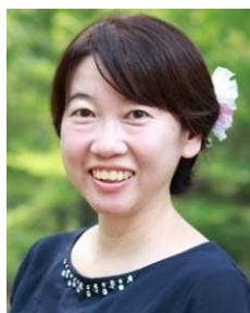
小野税務会計事務所 所長 税理士