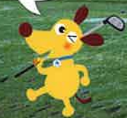
筑紫法人会キャラクター けんたくん