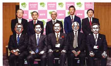
▲贈呈式に出席した皆さん

今年は、本市の6中学校へ計105冊の図書と「社会福祉法人はるかぜ福祉会」へチャリティーゴルフ大会の益金で災害時用の発電機などが寄贈されました。